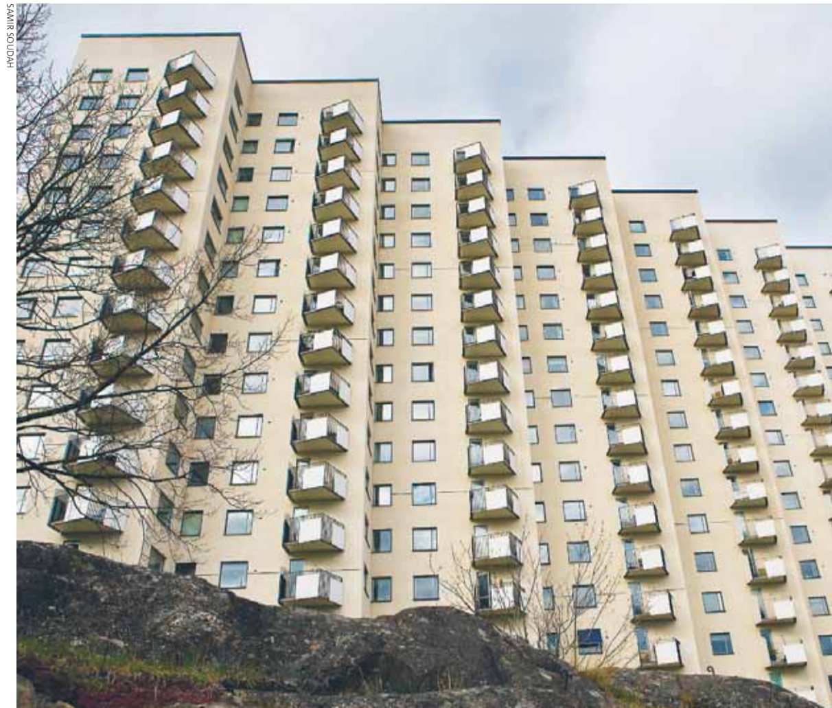
Huset på Fyrverkarbacken ser ut som ett dragspel och har även fått smeknamnet Dragspelet. Balkongutsikten över stan är hänförande.