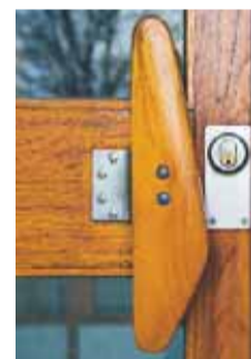
Trä blandat med betong ger en stilren design.

Tage Erlander, socialdemokratisk statsminister mellan 1946 och 1969, flyttade in i Dragspelshuset med sin familj när det var nybyggt.